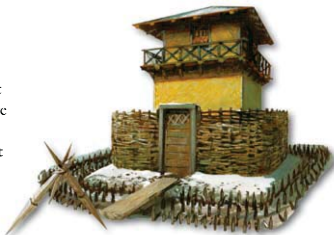
Vanuit de wachttoren wordt de grens bewaakt.

Soms is het niet nodig een groot fort te bouwen. Dan bouwen de Romeinen een wachttoren. Daar zijn minder soldaten voor nodig. Als er gevaar is, wordt op de wachttoren een vuur aangestoken. De soldaten op de andere wachttorens zien het vuur. Ze weten dan dat er wat aan de hand is. Dan komen ze eraan.